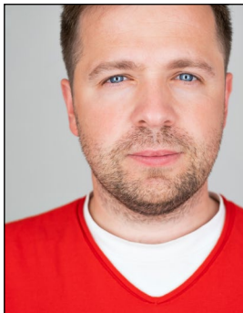
Kopf nicht vollständig